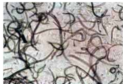
マツノザイセンチュウ(病原虫)