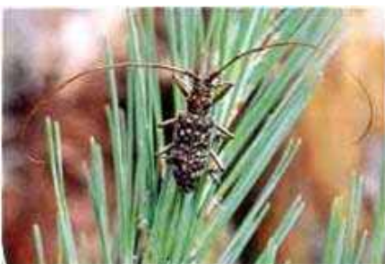
マツノマダラカミキリ(運び屋)