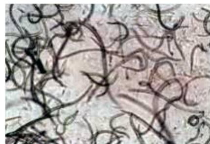
マツノザイセンチュウ(病原虫)