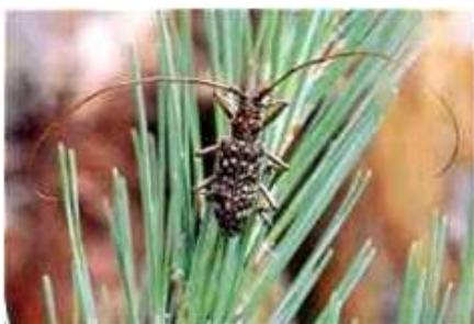
マツノマダラカミキリ(運び屋)