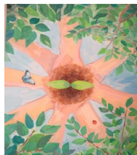
さくら市立氏家中学校