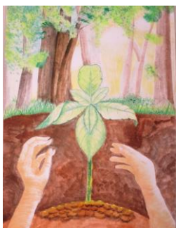
栃木市立西方中学校