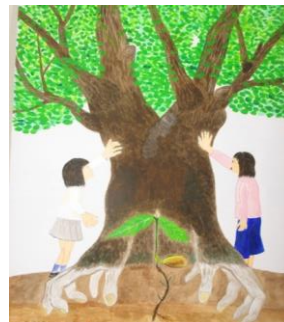
佐野日本大学中等教育学校