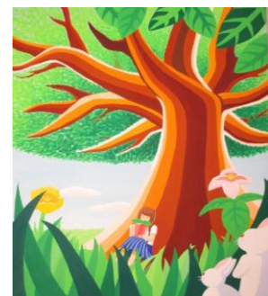
那須塩原市立東那須野中学校

私たちの手で妨げるのではなく、循環を続けていくのを促していきたいと願っています。