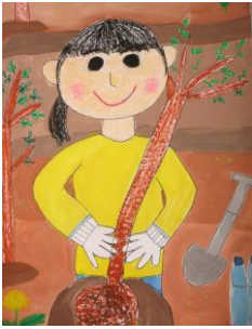
栃木市立皆川城東小学校