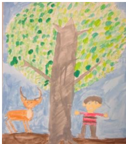
栃木市立大平南小学校