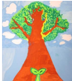
那須塩原市立稲村小学校

足尾銅山への植樹体験をしてきた時の様子を絵に描きました。自分の植えた小さな1本が大きくなるのが楽しみです。