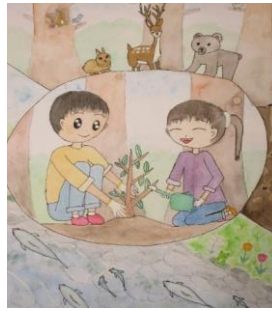
茂木町立逆川小学校