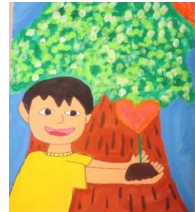
栃木市立皆川城東小学校