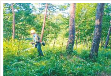
益子の森 下草刈り

町自然環境課と県立自然公園益子の森の環境整備、下草刈りと枯枝処理作業を実施しました。暑い日でしたが20名の参加者は熱中症になることもなく無事に予定していた作業をすることができました。