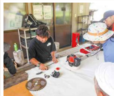
刈払機のメンテナンス講習