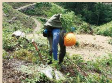
伐採後における 少花粉スギ苗の植林

栃木県では、大切な森林を守り育て、元気な森を次の世代に引き継いでいくために、平成20(2008)年度に「とちぎの元気な森づくり県民税」を創設し、「高齢化した森林の若返り」など“災害に強い森づくり”に向けた取組を進めています。