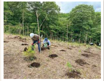
コナラ、クヌギの植樹

日の丸サンス織として3回目の参加となりました。弊社の場合、その事業形態からどうしても地域との結びつきが弱いことを懸念してきましたが、小さなながらも地域の自然や地元観光の後支えができないだろうか?との思いから今般の参加となりました。これからは法人として個人として貢献できることを模索しつつ、持続的な開発・貢献を視野に活動して参りたいと思います。