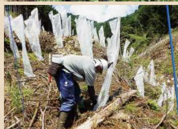
植林した苗木における シカによる食害防止 (ネットによる苗木保護)