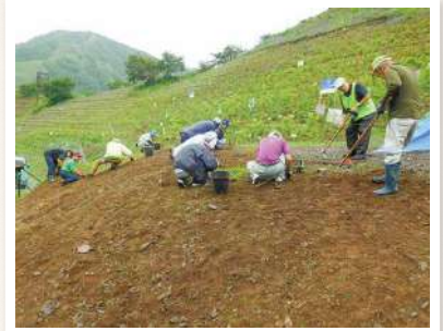
新たな植樹地の除草作業

梅雨時期で天候が心配でしたが、7月8日は小雨が降ったりやんだり雨模様での作業でした。森づくりサポーターの方に雑草の名前を教えてください、勉強になった有意義な作業でした。植樹地には今年植樹した60cmほどの苗木があり、雑草が一面に生えていました。草刈り機が使えない場所のため、手作業で伐根除草を皆さんに行ってくださいました。この時期は雑草の伸びも早く、機会があるごとに除草を行っています。