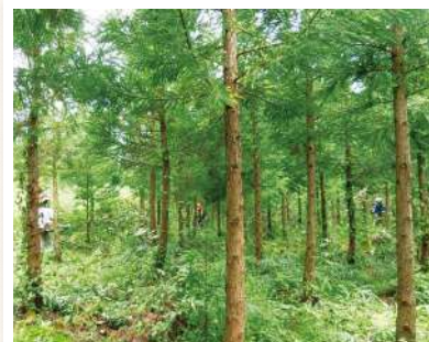
杉幼齢林の下刈り

毎年10月は公開活動「親子で森づくり体験」を開催しています。9月はその準備作業として会場となる杉幼齢林の下刈りを行いました。この会場は一昨年と昨年の「親子で森づくり体験」で南側半分は枝打ちをしましたが、奥の北半分は身動きが取れない状態でした。枝打ち効果の一面を実感しました。