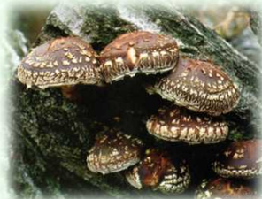
原木栽培しいたけ