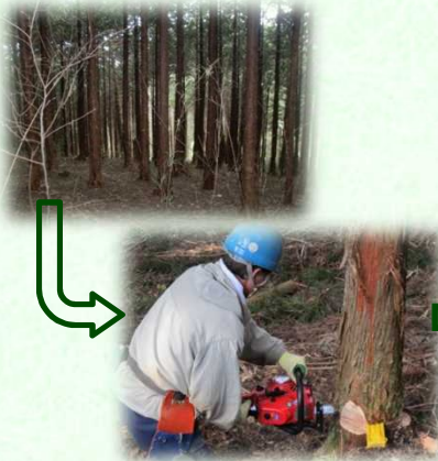
奥山林の間伐（矢板市）

皆様のご理解、ご協力のもと、ご負担いただいたとちぎの元気な森づくり県民税（個人：年額700円、法人：均等割額の7%）を活用し、県民協働による元気な森づくりを進めています。H30（2018）年度からは、森林の若返りのため、皆伐後の植栽の支援等に取り組んでいきます。