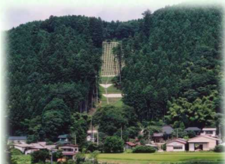
土砂流出防備保安林（那須町）

保安林には、土砂の流出を防ぐ「土砂流出防備保安林」、雨を貯えて洪水や濁水を防ぐ「水源かん養保安林」など、その種類に応じて様々な役割があります。