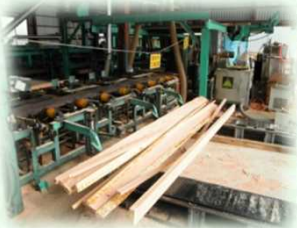
製材工場（那須塩原市）

主にスギやヒノキなどの針葉樹林から、家を建てるための柱や梁（はり）などが生産されています。