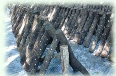
原木栽培しいたけのほだ木（芳賀町）