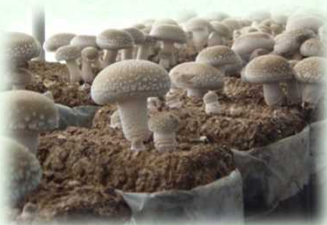
菌床栽培しいたけ

しかし、安全な栽培方法の研究・普及など放射性物質対策を進めてきた結果、出荷制限の一部が解除されてきており、対策の効果が着実に表れてきています。