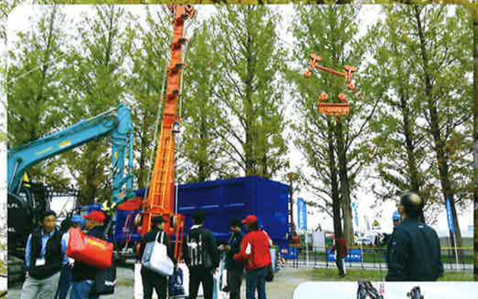
森林・林業・環境機械展示実演会