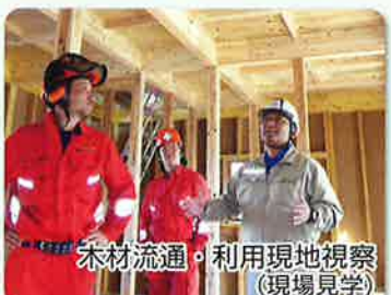
木材流通・利用現地視察 (現場見学)