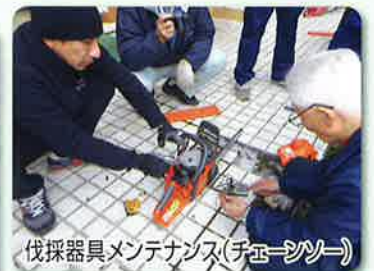
伐採器具メンテナンス(チェーンソー)