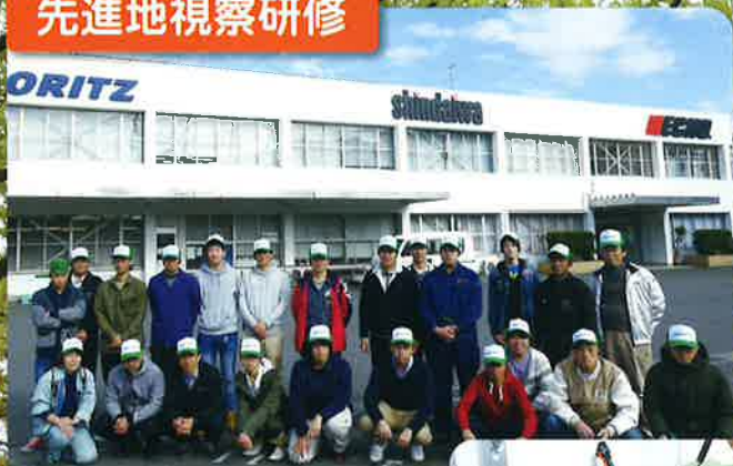
株式会社やまびこ