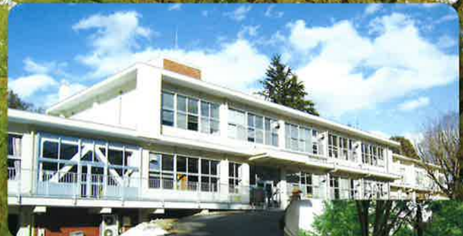
栃木県林業センター (宇都宮市下小池町)