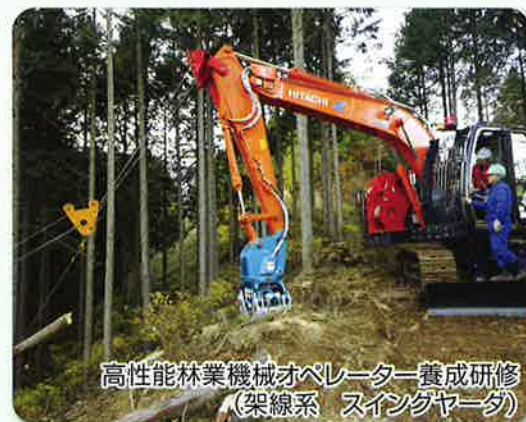
高性能林業機械オペレーター養成研修 (架線系 スイングヤーダ)