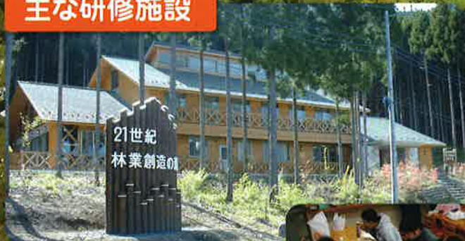
栃木県21世紀林業創造の森 (鹿沼市入栗野)