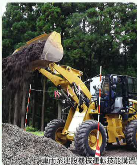
車両系建設機械運転技能講習