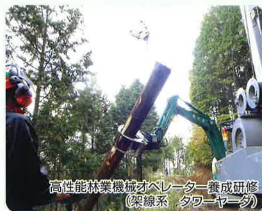
高性能林業機械オペレーター養成研修 (架線系 タワーヤーダ)