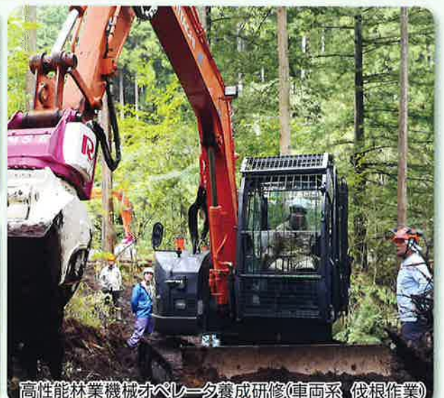
高性能林業機械オペレータ養成研修(車両系 伐根作業)