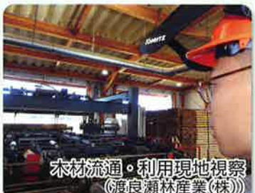
木材流通・利用現地視察 (渡良瀬林産業(株))