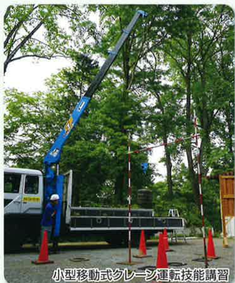
小型移動式クレーン運転技能講習