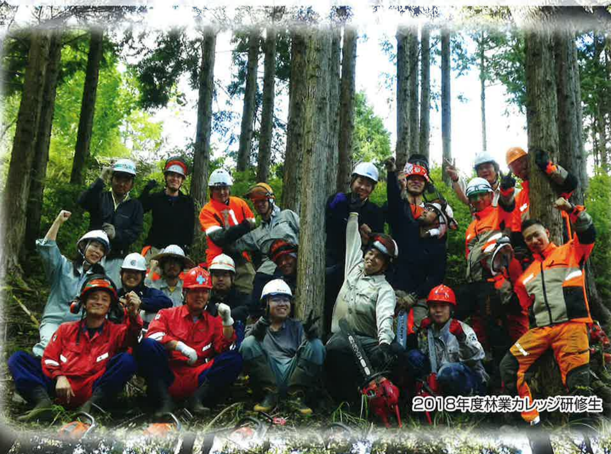
2018年度林業カレッジ研修生

栃木県内の素材生産等を行っている事業者の中核となる林業従事者を養成するため、森林・林業に関する幅広い知識と林業の専門的知識及び技術の習得を目的に行う研修です。