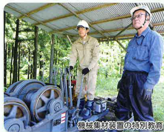
機械集材装置の特別教育