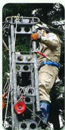
林業架線作業主任者講習 (張力検定)