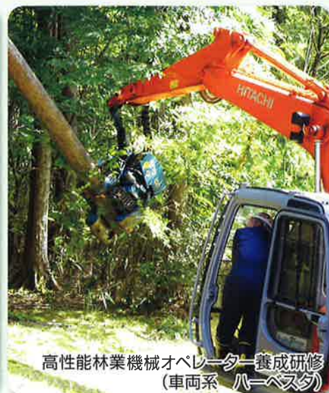
高性能林業機械オペレーター養成研修 (車両系 ハーベスタ)