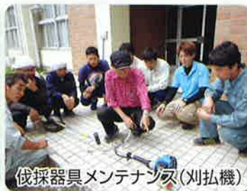
伐採器具メンテナンス(刈払機)