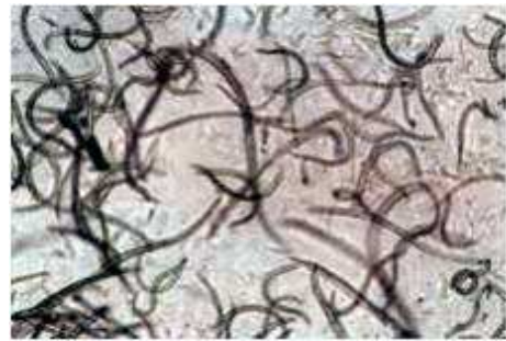
マツノザイセンチュウ(病原虫)